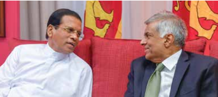
සමාජ සාධාරණත්වය සහ වෙළඳපොළ තරඟකාරීත්වය සුසංයෝග වූ සියලු දෙනාටම ප්‍රතිලාභ හිමිවන දැනුම පදනම් කරගත් ඉහළ තරඟකාරී සමාජ වෙළඳපොළ ආර්ථිකයක් ගොඩනගන්නයි.

පසුවිපරම සහ සම්බන්ධීකරණය අත්‍යවශ්‍යමයි ඕනෑම කටයුත්තක් සාර්ථක වෙන්න නම් පසු විපරම සහ සම්බන්ධීකරණය ඒ කටයුත්තේ මූලික අංගයක් වෙන්න ඕනෑ. ආණ්ඩුව අතර සම්බන්ධීකරණය වගේම ආණ්ඩුව හා පෞද්ගලික අංශය අතර සම්බන්ධීකරණය තිබිය යුතුමයි. මේ කටයුත්තට නවීන තාක්ෂණයත් යොදා ගන්න වේවි.